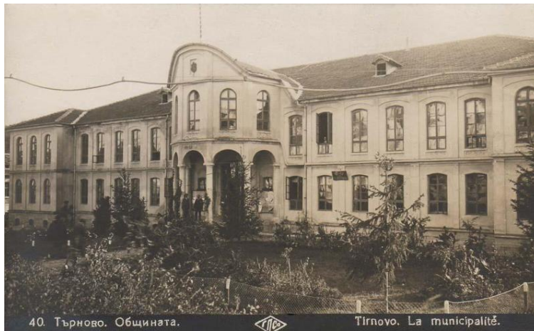
40. Търново. Общината.